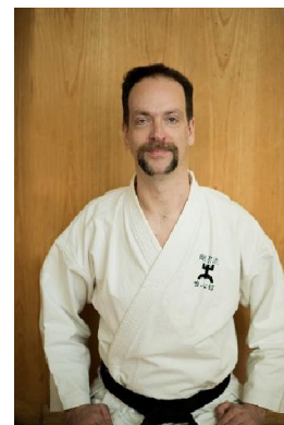
Renshi - 5. Dan

Ort: Turnhalle in der Paul-Fleming-Oberschule Bahnhofstraße 8 08118 Hartenstein (Zufahrt über Hermann-Löns-Weg)